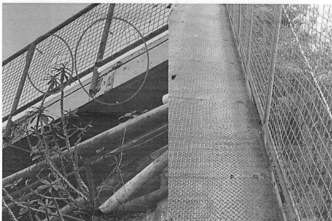
Figura 2. Vista da escada em direção ao guarda corpo da passarela, presença de vegetação na cabeceira da ponte.